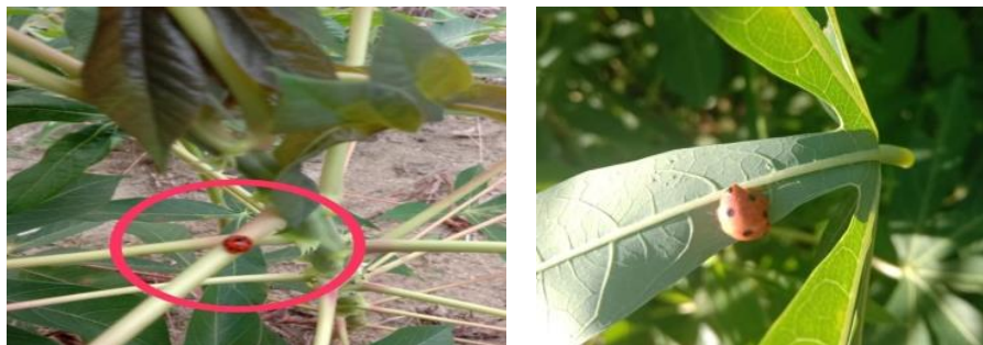
Gambar 2. Predator alami (kumbang koxi) hama kutu putih dan kepinding tepung di Kampong Tanah Bara Kecamatan Gunung Meriah, Aceh Singkil