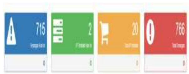
Gambar 5.Contoh Lokasi IP Penyerang

Terakhir, terdapat juga laporan lokasi IP penyerang dengan google map, dapat di lihat pada gambar 5.