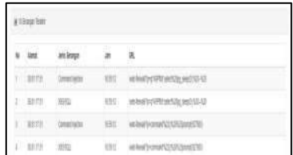
Gambar 4. Contoh Tabel Laporan

Kemudian pada gambar 4 menunjukan 10 serangan terakhir sehingga admin dapat memantau serangan