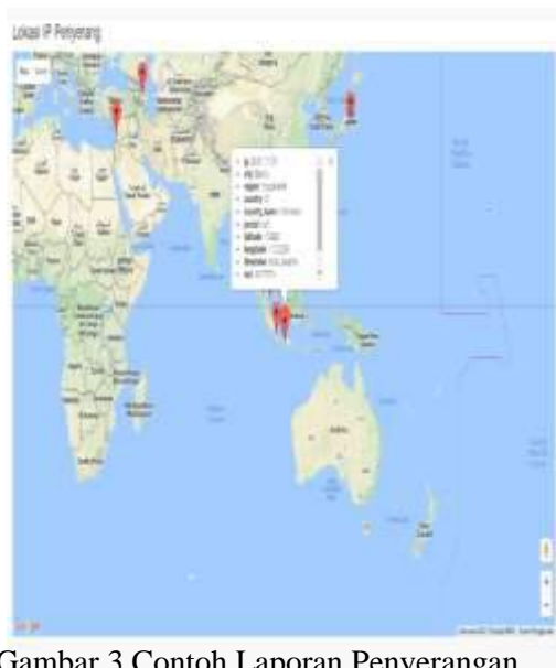
Gambar 3.Contoh Laporan Penyerangan

Dari Log Serangan yang telah ada, aplikasi pengaman web akan membuat laporan lokasi IP penyerang berbentuk map dan menampilkan 10 serangan, dapat di lihat pada gambar 3 berikut ini.