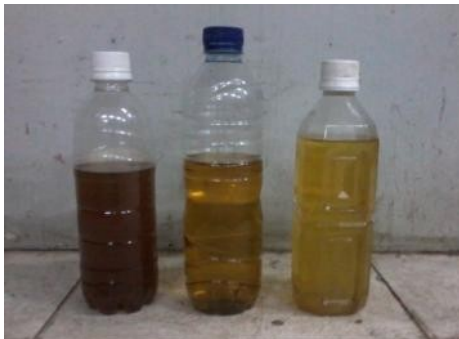
Gambar 4. Minyak dari hasil pengolahan plastik tipe PP dengan variasi laju kalor

Dengan laju kalor yang berbeda, ternyata juga menghasilkan warna minyak yang berbeda. Perbedaan warna minyak yang dihasilkan dari masing-masing laju kalor dapat dilihat pada gambar 4.