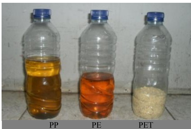
Gambar 3. Minyak dari hasil pengolahan beberapa tipe sampah plastik

Dari data di atas diketahui bahwa ditinjau dari jumlah energi yang dibutuhkan dan jumlah minyak yang dihasilkan, plastik jenis PP adalah jenis plastik yang paling bagus bila diolah menjadi bahan bakar. Dapat dilihat pada pengolahan plastik PP, LPG yang dipakai adalah paling sedikit sedangkan jumlah minyak yang dihasilkan lebih banyak dari plastik jenis PE. Sedangkan dari penelitian ini diketahui bahwa plastik jenis PET tidak menghasilkan minyak sama sekali. Material yang keluar dari kondenser semacam serbuk berwarna kekuning-kuningan. Bahkan serbuk ini menempel di sepanjang saluran pipa. Dari hasil ini diketahui bahwa plastik tipe PET tidak potensial untuk diolah menjadi bahan bakar minyak.